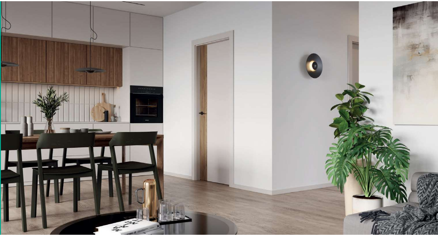
PORTA DUO 4.0, Kašmír s dubom tmavým matným, kľučka FIORO čierna