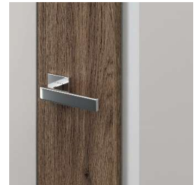
kľučka ELEGANTO, model 4.A