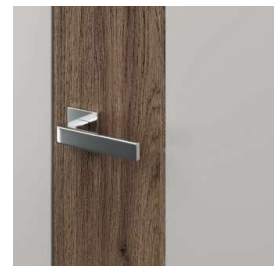
kľučka ELEGANTO, model 4.0